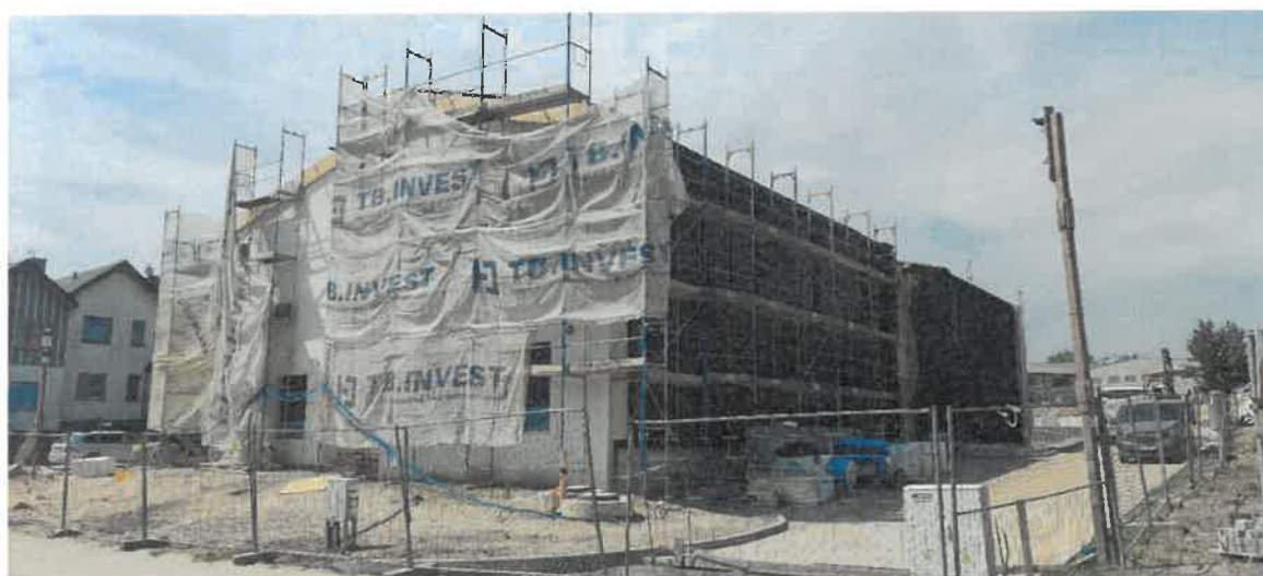
Budowa Przedszkola Miejskiego w Skórczu - inwestycja w trakcie realizacji.