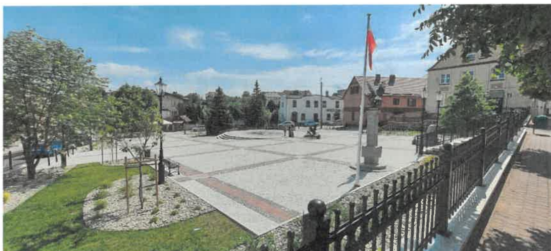
Rewitalizacja Rynku Maślanego