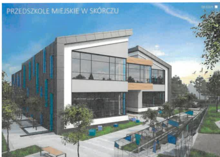
Budowa Przedszkola Miejskiego w Skórczu – projekt.