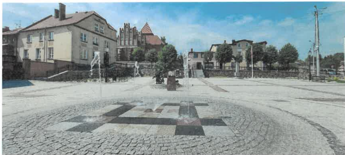
Rewitalizacja Rynku Maślanego