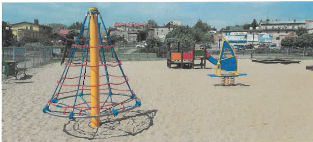
Doposażenie placów zabaw.