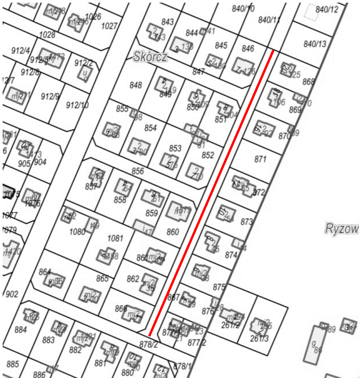
Przebieg drogi gminnej Nr 241040G – ul. Sadowej w Skórczu